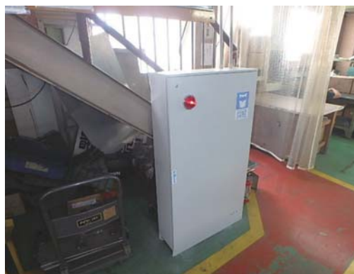
設置されたパッケージ型消火設備の状況

○平成30年5月24日 設備検査でパッケージ型消火設備の設置を確認。違反は是正された。