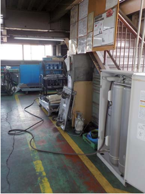
初期消火の状況(右は建物2階の休憩室)