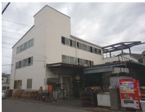
違反対象物の外観